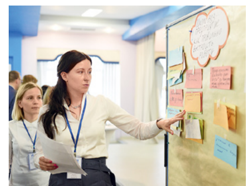
Решение HR-кейсов проходило в формате фасилитации

Кроме докладов и обсуждений, в рамках конференции были организованы четыре тематических круглых стола, на которых решались реальные кейсы из области кадровой политики – такие как взаимодействие предприятий энергетике со школами и вузами, развитие научно-технического потенциала среди молодежи Группы, адаптация молодых специалистов, целевая подготовка студентов. Завершила программу конференции интеллектуальная игра «Что? Где? Когда?». ■