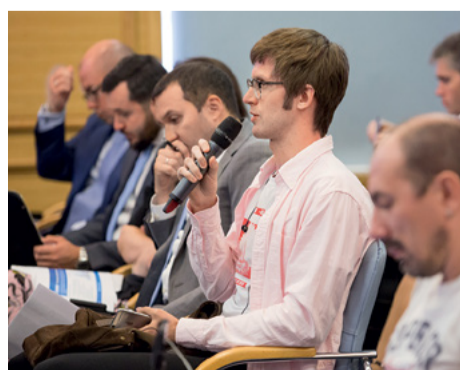
В ходе пресс-конференции глава «Газпром энергохолдинг» ответил на вопросы журналистов

В условиях падения производства и продаж газовых турбин в Европе 33 ГТЭ – это огромный рынок. И если будет принято