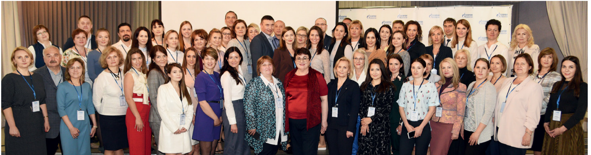
В мероприятии приняли участие более 60 руководителей и специалистов по персоналу компаний Группы