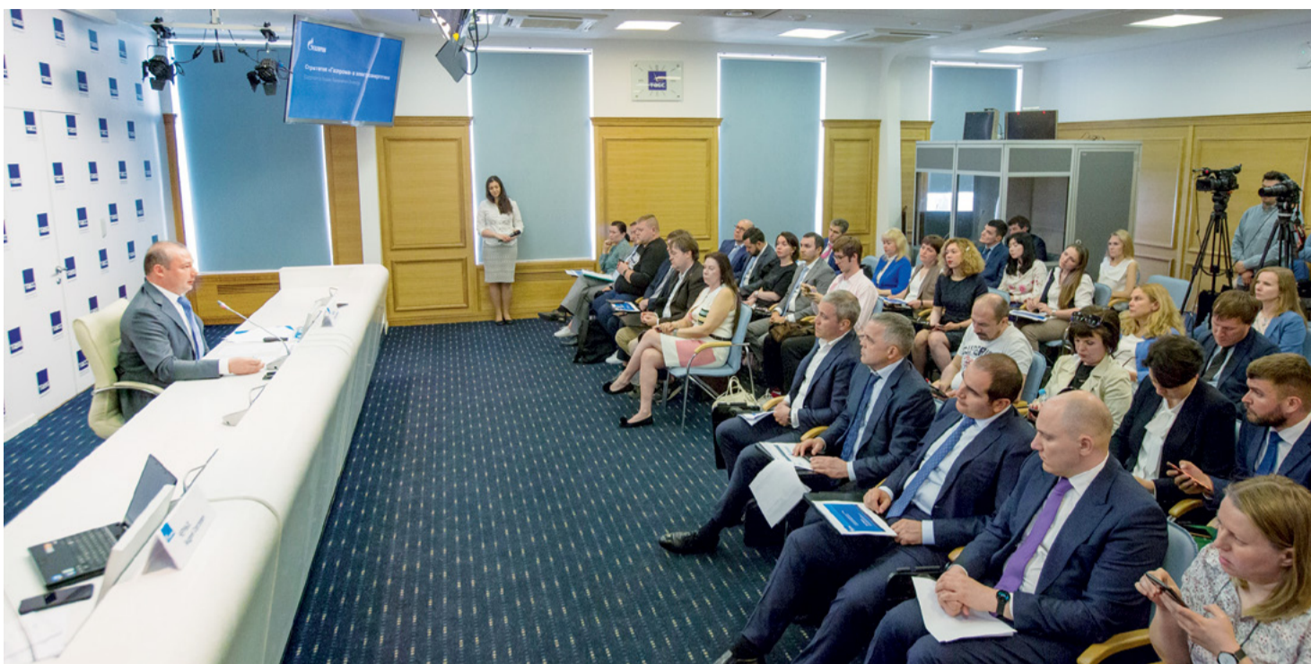
Мероприятие прошло в пресс-центре ТАСС в Санкт-Петербурге