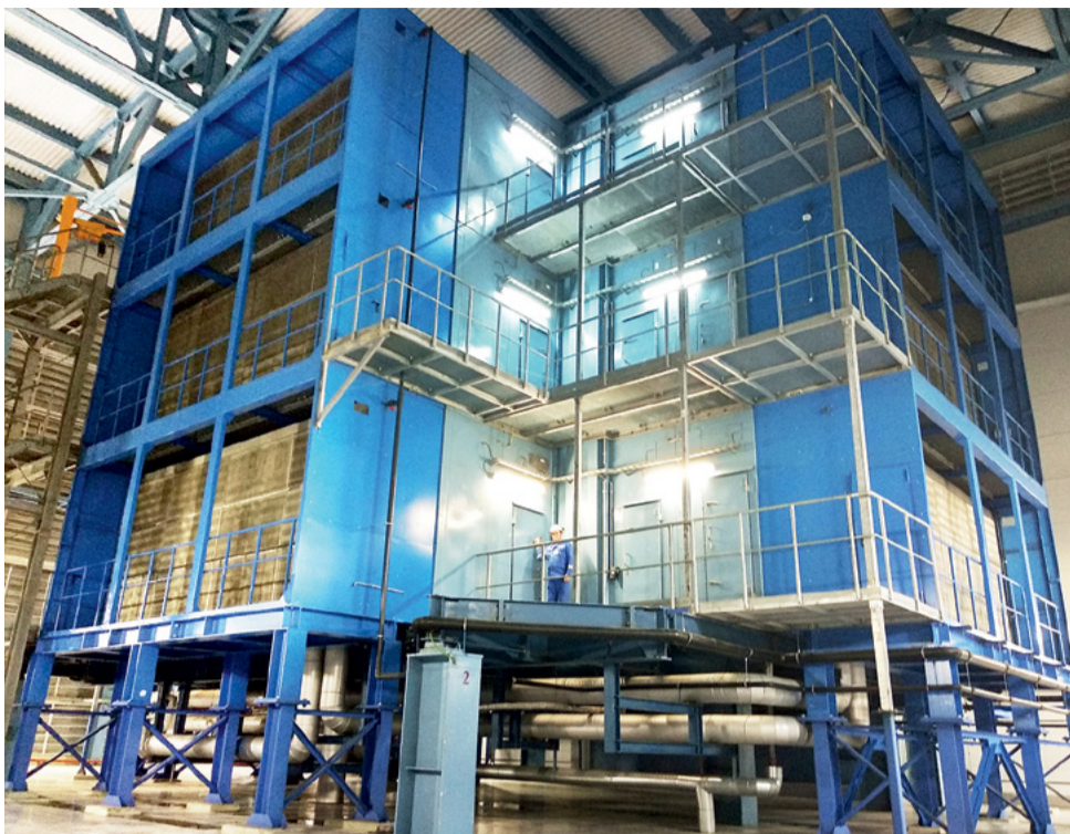
Испарительная установка смонтирована на входе в КВОУ газовой турбины