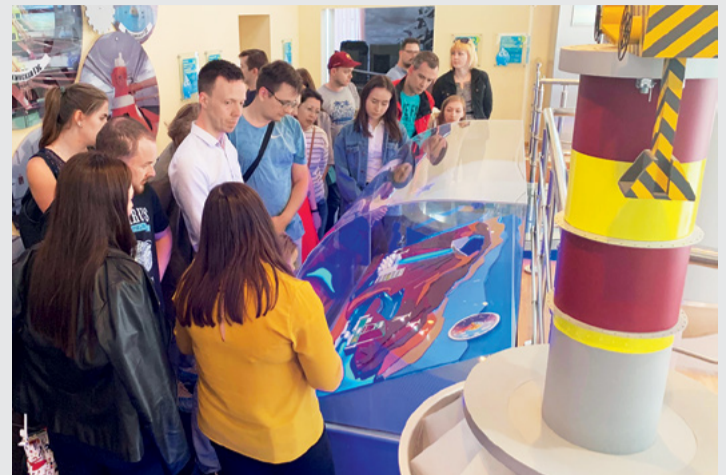
Знакомство с экспозицией Музея гидроэнергетики России