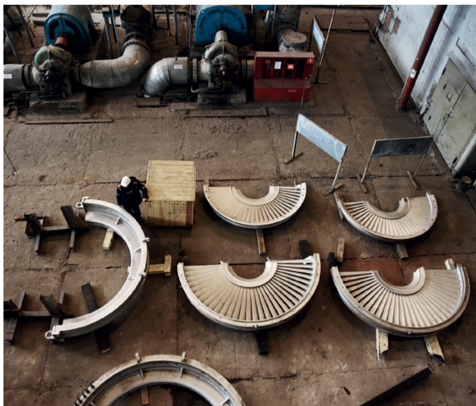
Площадка реконструируемого энергоблока № 9 ТЭЦ-22, февраль 2019 года