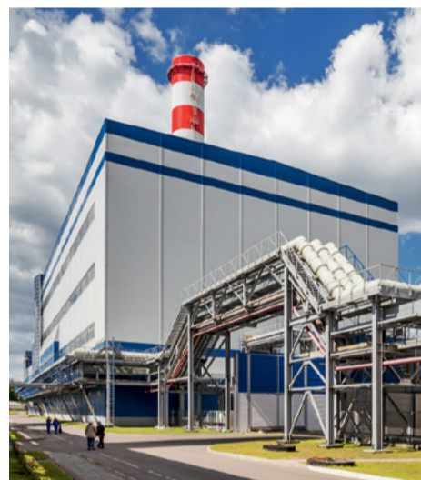
Энергоблок ПГУ ТЭЦ-20 введен в декабре 2015 года

В настоящее время ведется подготовка к монтажу аналогичной испарительной установки на ПГУ ТЭЦ-16. В дальнейшем Мосэнерго рассматривает варианты оснащения испарительными установками подобного типа КВОУ газовых турбин ТЭЦ-12, ТЭЦ-26, ТЭЦ-21 и ТЭЦ-27. ■