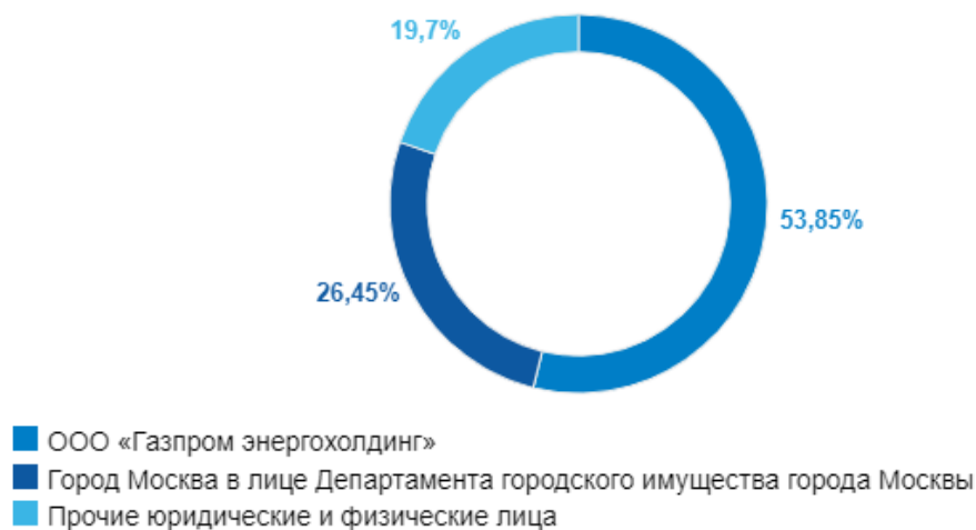
Диаграмма 1. Структура акционерного капитала 1

Сведения о лицах, которые прямо или косвенно владеют акциями, составляющим пять и более процентов уставного капитала ПАО «Мосэнерго» по состоянию на 31.12.2023: